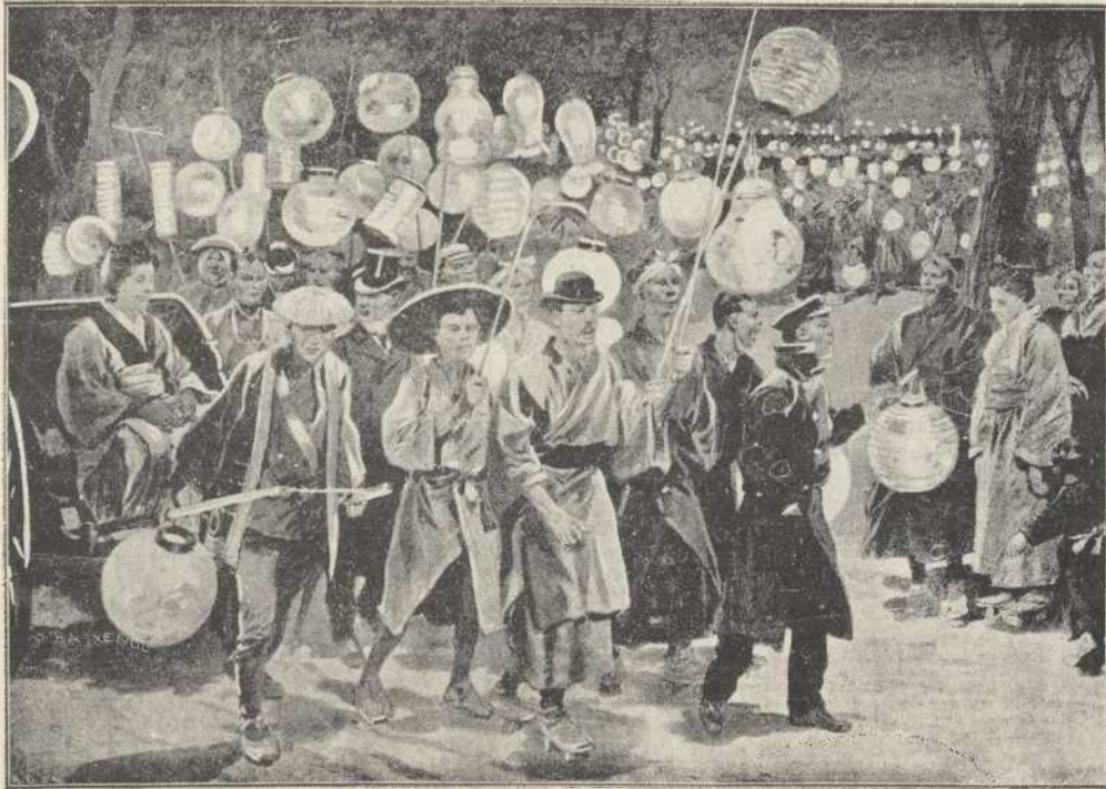
UNA MANIFESTACIÓN EN TOKIO

¡Pobre cabeza de Belcebú! Iba quedando limpia como un campo de trigo azotado por viento tempestuoso.